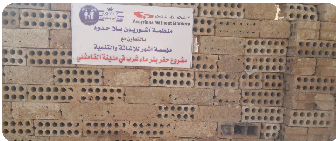
Vattenbrunnen i Al-westa, i Qamishli, som kommer väl till pass då vatten delas ut till assyrier i Qamshli

Jag har levt nästan hela mitt liv i Syrien, och är uppväxt i staden Qamishli. Situationen i landet har tvingat mig att lämna mitt hem och börja om på nytt i Sverige. Här har jag nu bott i 3 år. Under sommaren var jag åter igen i Qamishli, Syrien. Fast denna gång var jag där som en gäst. Mycket av det jag har sett där under detta besök, känner jag till sedan tidigare och det kanske du också gör. Fast när man upplever det på plats, är det en helt annan sak.