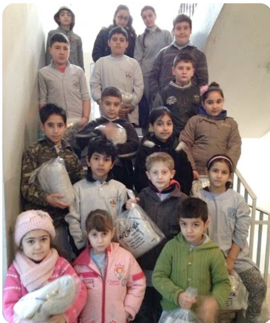
Skolbarn som fått nya skoluniformer.

I projektet som döpts till ”Right to education for refugee school children in Bourj Hammoud” har Assyrier Utan Gränser beviljat hjälp till 41 assyriska skolbarn, i olika åldrar, som år 2014 flytt från krigens Syrien. Varje elev har fått en skolväska med 2 skoluniformer samt en idrottsuniform. Eleverna kommer dessutom få en daglig lunchsmörgås under vårterminen 2015. Skolan har även behövt uppdatera sin tekniska utrustning med nya datorer, programvaror, TV-apparat etc. för att kunna hålla en modern undervisning samt möta det kraftigt ökade elevantalet. Detta har Assyrier Utan Gränser delvis finansierat då skolan delar kostanden för utrustningen och lägger på varje elevs årsavgifter.