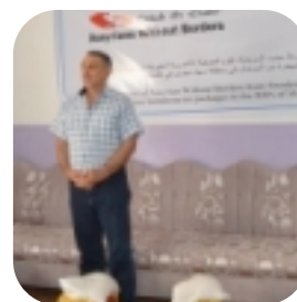
Bilder från akutinsatsen i Irak

Att Irak och dess invånare, och speciellt assyrierna, under flera år har genomlidit krig och elände är fakta. Assyrierna i Irak stod återigen inför stridigheter och katastrofer. Den första veckan av katastrofen innebar att ca 900 assyriska familjer flydde från Nineveh, (Mosul). Av de 900 assyriska familjer som Assyrier Utan Gränserns samarbetspartners hade lokaliserat hade ca 600 sökt skydd i Nineveh-slätten. Andra hade sökt sig till Nohadra, (Dohuk), och Erbil, där kurdiska myndigheter delade ut endast 15 dagar långa uppehållstillstånd.