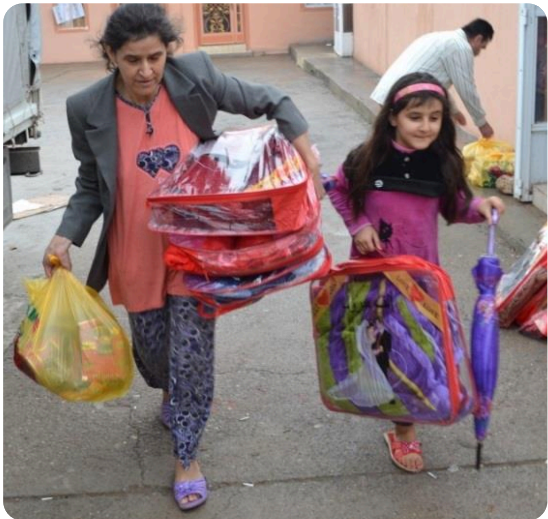
Projekt 3 – Utdelning av filter och mattor m.m. i samarbete med A Demand For Action och Chaldo-Assyrian Student and Youth Union

Utdelning av filter, mattor m.m. har skett i bl.a. Ankawa.